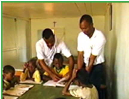
« Encadrement scolaire des orphelins par des éducateurs au Centre »