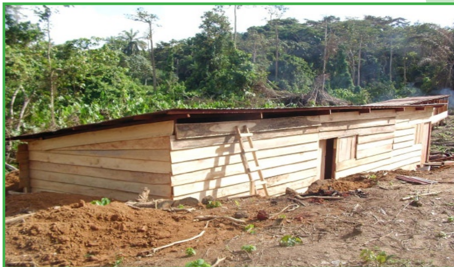
« Vue de l'aulacoderie »