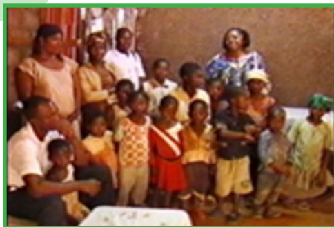
«Orphelins dans une famille d'accueil»