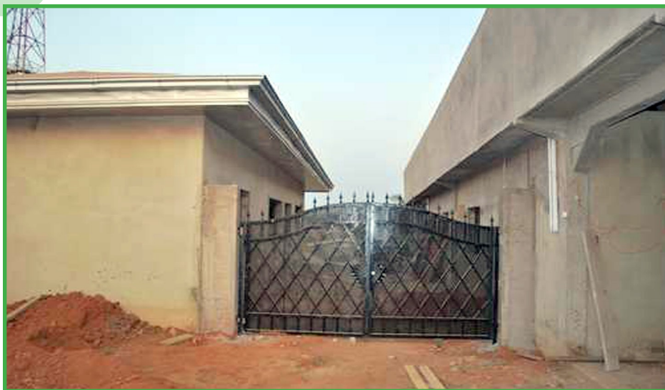
«Vue des salles de classes»