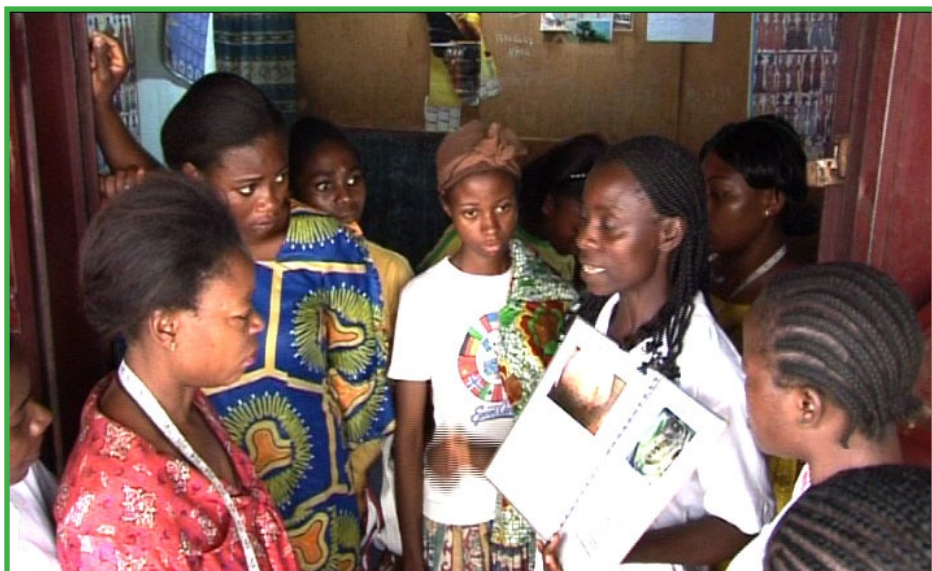
«Une éducatrice en pleine conversation communautaire»

Lutte contre la pauvreté à travers la vulgarisation du planning familial.